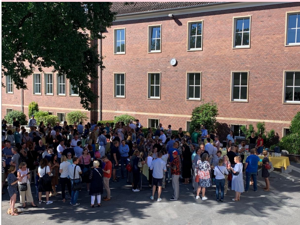
Die schattigen Stehtische im Pausenhof waren ein beliebter Treffpunkt beim Einschulungsbuffet des Förderkreises.