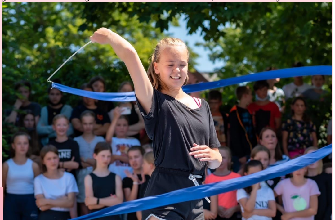
Schnappschuss vom Zirkusprojekt vom Autor aufgenommen.