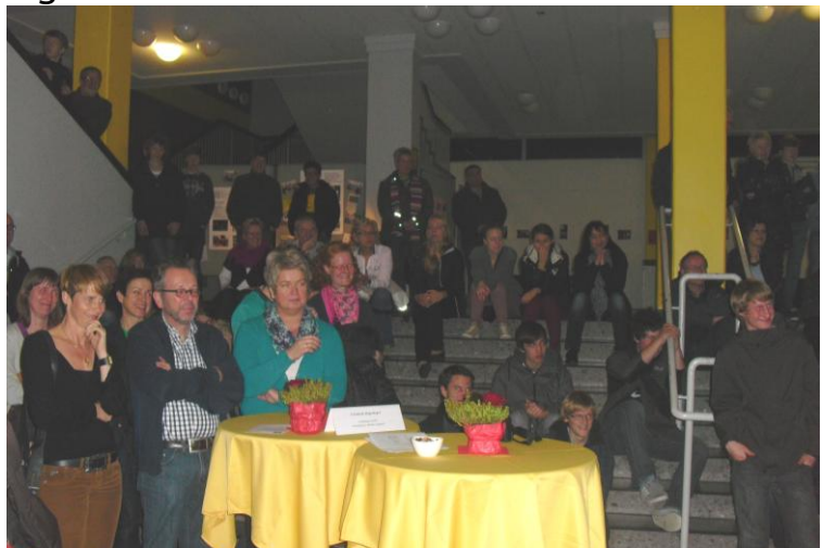
Die vorerst letzte Veranstaltung „Traumberufe“ im November 2012

Im Jubiläumsjahr 2013 setzt der Förderkreis seine seit 2007 initiierte alljährlich stattfindende Veranstaltung „Traumberufe“ erstmals aus. Da inzwischen von zahlreichen Institutionen und auch seitens der Schule unzählige Anregungen im Hinblick auf die spätere Berufs- oder Studienwahl geboten werden, ist jetzt eine neue Konzeption gefragt, um das traditionelle