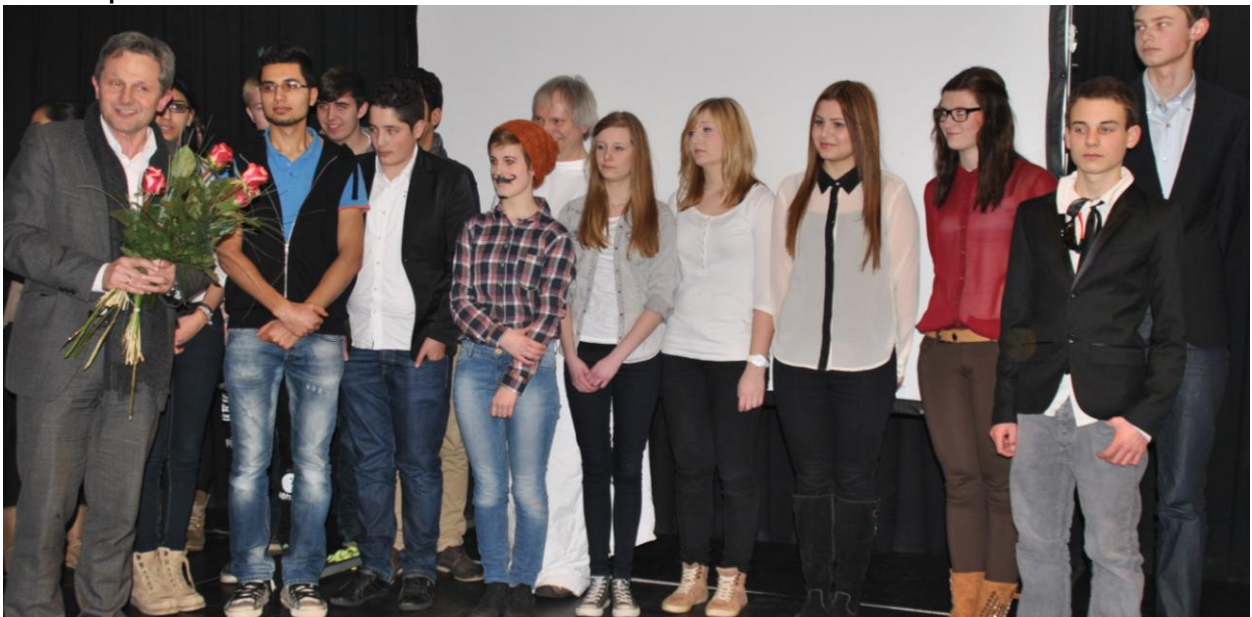
... sowie der philosophische Nachwuchs

Schüler der Philosophie-Kurse Heiteres und Besinnliches, aber in jedem Fall topaktuelle Szenen und Texte zum Thema.