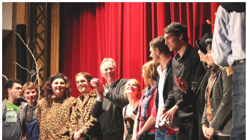
Die Shakespeare-Truppe freut sich mit der Schulleitung über die gelungene Aufführung