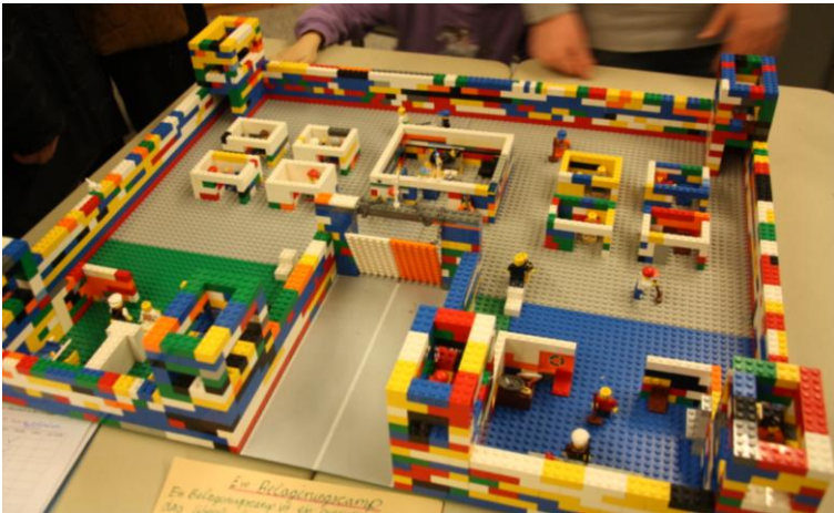
Lego im Geschichts- und im Religionsunterricht? Warum nicht! Das Projekt der 6c

Schülerinnen und Schüler und ihrer Lehrkräfte. Zwei Fächer legen gemeinsam ein am Lehrplan orientiertes Projektvorhaben fest und arbeiten intensiv an jeweils zwei aufeinanderfolgenden Stunden in der Woche an dem Projekt. Und so hatten die interessierten Eltern, Großeltern und Ge-