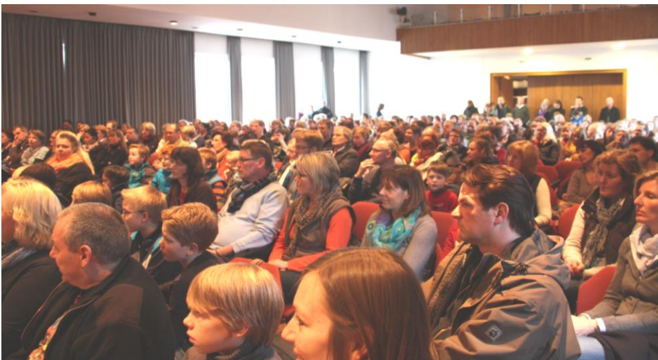
Das Publikum erschien zahlreich und lauschte, betrachtete und bedachte die vielfältigen Projektdarbietungen der Jahrgangsstufe 6.

aus dem Sportunterricht einbringen konnten, oder das alte Rom und das Zusammenleben der Römer mit den Christen wurde anhand von Wandzeitungen und einem riesigen Legomodell nähergebracht. Die Weltreligionen wurden jedoch auch auf musikalische Weise beeindruckend dargestellt, indem typische Musikstücke zu den verschiedenen Religionen dargeboten wurden. Musikalisch ging es auch im Musikraum 1 zu, in