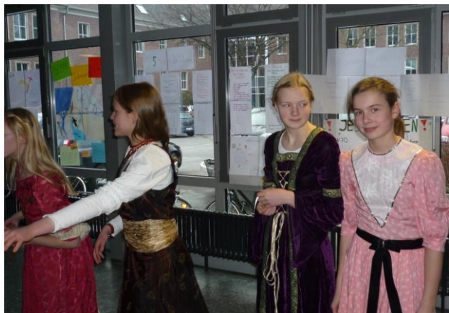
Alte Volkstänze bot die 6d in der Pausenhalle dar.

dem „i“ und zeigt die Ergebnisse einer sechswöchigen Arbeit der