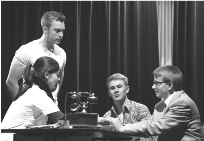
Mr. Elwood P. Dowd — hier ohne seinen Freund Harvey — beim Arzt

Gleich drei Aufführungen gab es in diesem Jahr aus den Literaturkursen der Q2: