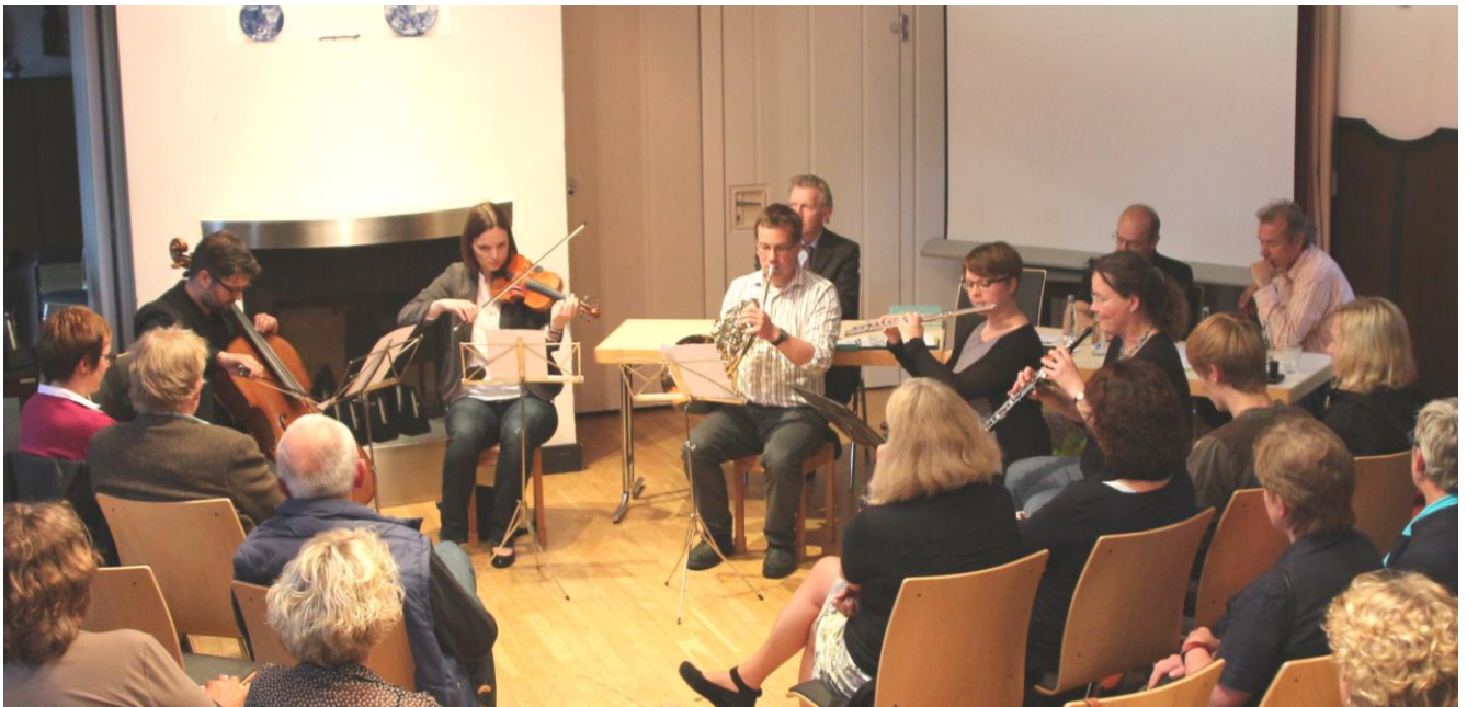
„Jeder tickt anders...“ – Konstruktivistische Tongebungen von Steve Reich, György Ligeti und John Cage als musikalisches Intro und Intermezzo während des 3. Grevenener Hochschultages

(1) Ohne Konstruktivist sein zu müssen, ist zu erkennen: Eine konstruktivistische Unterrichtspraxis ist bereits Praxis in verschiedenen Fächern bis in die Naturwissenschaften hinein – die Diskussion über die Vorzüge eines Schweizer Mathematik-Lehrbuches war hier nur ein Beispiel. Erkennbar ist aber auch: Ein Haus des Lernens wird immer nur ein Fundament haben können, welches an verschiedenen Standorten verschieden konstruiert sein mag, aber nicht konstruktivistisch das Nebeneinander und Übereinander mehrerer Fundamente beinhaltet.