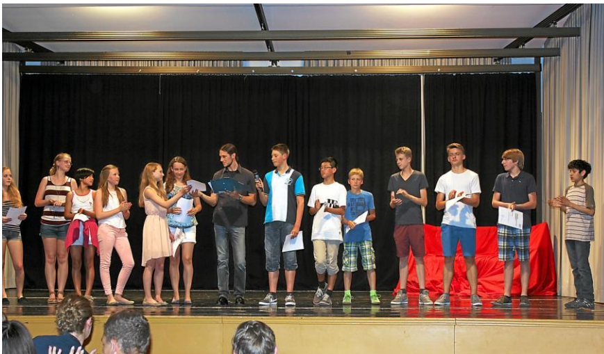
Ehrung besonderer Schülerleistung im Juli 2013

Der Förderkreis hat auch in diesem Jahr wieder viele Projekte gefördert, die das Arbeiten und Lernen am Gymnasium Augustinianum verbessern und das Schulleben bereichern.