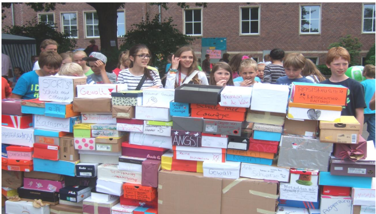
Die Mauer gegen Rassismus. Eine Aktion der SV

Am Tag des Schulfestes tummelte es sich auf dem Schulhof, er war Jahr-