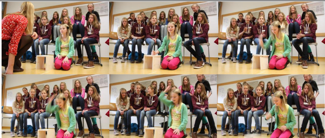
Schülerinnen der Klasse 7c, d und f schaffen es, ein Brett mit bloßer Hand und viel Willenskraft durchzuschlagen

auch etwas auszusprechen, was vielleicht stört oder belastet. Wichtig war, dass für alles eine gemeinsame und befriedigende Lösungsrichtung gefunden wurde. Am Schluss war klar: „Wir können eine Klasse sein!“ In Zusammenarbeit mit Andreas Raude vom Arbeitskreis Soziale Bildung (asb) hat Julia Al-Sibai das Konzept für diesen Projekttag im Rahmen des Gesamtkonzepts zum Sozialen Lernen am Augustinianum entwickelt und koordiniert. Ermöglicht wurde der aufwendige Projekttag durch das finanzielle Engagement der Fiege-Stiftung, die die Kosten übernommen hat.