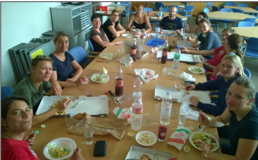
Gemeinsames Mittagessen während der Rettungsaktion anlässlich des Hochwassers

Das große Regenerereignis am 28. Juli in Greven, also inmitten der Sommerferien, verursachte am Gymnasium Augustinianum den wohl größten Einzelschaden im Stadtgebiet: Sämtliche tiefergelegene Geschosse in allen Gebäudeteilen, einschließlich Sporthalle, waren zum Teil bis zur Kellerdecke überflutet. Die Fotos auf dem Titelbild dieses Schulbriefes geben