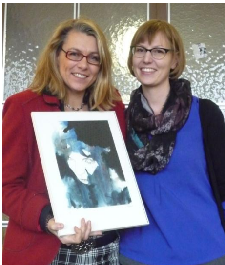
„Szenen aus der Lehrerschaft“