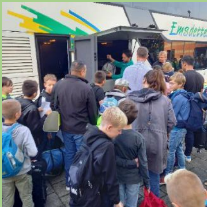
Jg. 5: 1 ÜB in Tecklenburg

Unser aktuelles Fahrtenprogramm in der Sekundarstufe I