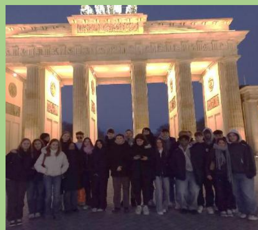
Jg. 10: 4 ÜB in Berlin