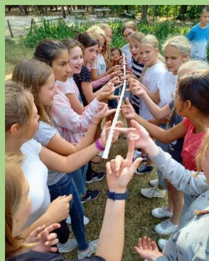
Jg. 7: 2 ÜB in JHB im näheren Umkreis mit päd. Programm

Zwei Umfragen bewegten uns dieses Halbjahr, die eine zum Thema „Schüler:innen-Gesundheit“, die andere zum Thema „Fahrtenkonzept“. Zunächst möchte ich mich für die zahlreiche Teilnahme bedanken. Sie hilft uns, dass wir gute Entscheidungen treffen können, die die Meinung nicht nur weniger Personen widerspiegeln, sondern den Großteil der von uns in der Schulkonferenz vertretenen Eltern.