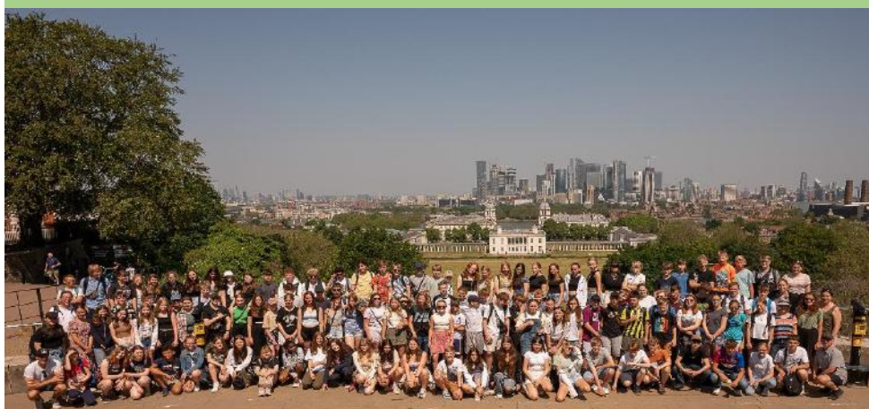
Jg. 8: 5-tägige Fahrt nach Südengland